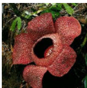
ラフレシアの模型、